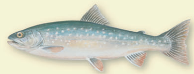
Røye ( Salvelinus alpinus ) – lever langs bunnen på dypt vann eller i de fri vannmassene og når ca 30 cm lengde. Gyter på grunner i innsjøen i oktober.