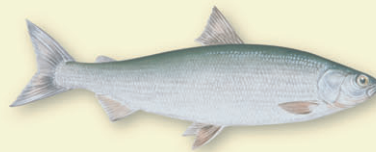
Sik ( Coregonus lavaretus ) – Femund har fire ulike sik-former, noe som er svært uvanlig i norsk sammenheng. Lever i de fri vannmassene og langs bunnen ned til 20-30 m, ungfisk oftest dypere enn 20-30 m.