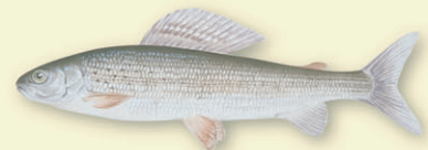
Harr ( Thymallus thymallus ) – lever nær land, gyter om våren i tillopselver og -bekker.