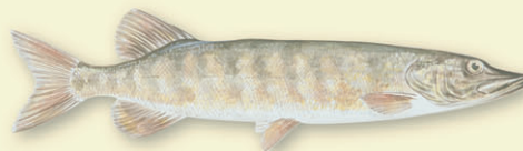
Gjedde ( Esox lucius ) – rovfisk som kan bli over 10 kg. Lever langs land, i Femund begrenset til grunne sivbevokste vikar, særlig Tufsingadeltaet. Gyter om våren.