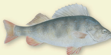
Abbor ( Perca fluviatilis ) – vanligst i lune vikar nær land. Kan bli over 1 kg. Stor abbor er rovfisk. Gyter om våren.